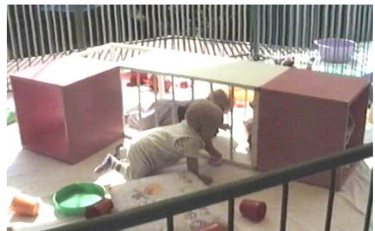
«Moverse en libertad» filmaren fotograma